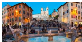
Gigolos aus Rom