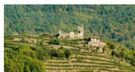
Die Edeltrauben am Inferno