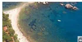
Enge Gassen und leichtes Leben