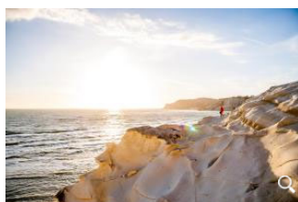
>> Hier geht es zu den schönsten Stränden Siziliens

Von den Zimmern des Bed& Breakfast Finestra Sul Sale zwischen Marsala und Trapani sieht man ein weißes Blumenmeer. Das schlichte Haus liegt nämlich in den Salinen, in denen mit traditionellen Techniken Meersalz gewonnen wird. Hier ernten sie »Fiore di Sale«, schönste – Salzblumen.