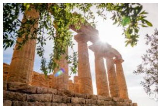
>> Alle Highlights von Sizilien auf einer interaktiven Karte zusammengefasst

Es steckt voller Leidenschaft, dieses 400 Jahre alte Anwesen südlich des Ätna, das heute Azienda Trinità heißt: Da ist der mit Hingabe gestaltete botanische Garten, durch den ein verwinkelter Weg führt – an einem noch intakten arabischen Aquädukt entlang und vorbei an Olivenbäumen, Kakteen, Obstgärten und Lavaplatten, die an den Vulkanausbruch im 17. Jahrhundert erinnern. Mit Liebe sind die acht kleinen Häuschen gestaltet, die im Garten verteilt stehen, Holzdecken und rauverputzte Wände haben. Und mit Leidenschaft wird hier auch schlicht das Leben gefeiert: Wenn der hundertjährige Nonno auf einen Teller Pasta einlädt und von früher erzählt, als er am selben Tag erst Ski fahren war und dann im Meer baden.